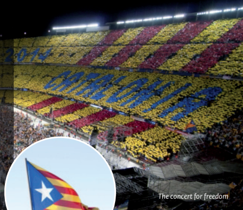
The concert for freedom

Die Grundwerte des FC Barcelona, also die Verteidigung der katalanischen Kultur und der Demokratie, sowie seine Bürgernähe teilt auch die ANC. Diese basisdemokratische Bürgerbewegung setzt sich friedlich, u.a. gemeinsam mit dem FC Barcelona, für die Unabhängigkeit Kataloniens ein.